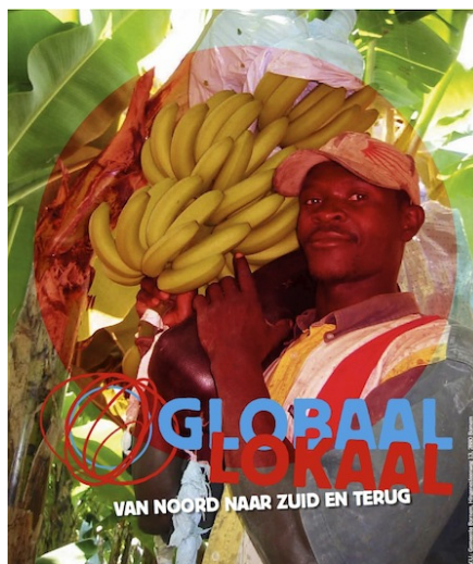
Globaal wordt lokaal is een initiatief van Vredesnieuws Puurs, 11.11.11 Antwerpen, Gemeente Bornem en Vormingsregio Mechelen met medewerking van CC Ter Dift en CC De Kollebloem.

Hoe universeel is de universele verklaring van de rechten van de mens? Zijn de rechten uit deze verklaring toepasbaar op andere samenlevingen dan de Westerse?